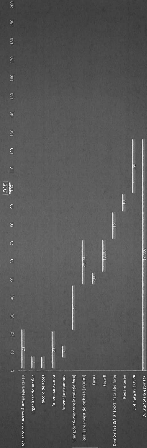
Diagramă estimare realizare sondă 37 BOGATA